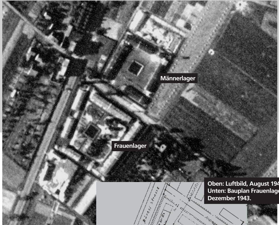
Oben: Luftbild, August 1944. Unten: Bauplan Frauenlager, Dezember 1943.

Auch hier waren die Baracken um einen Löschteich angeordnet. Neben den Unterkerftsbaracken gab es noch eine Werkstattbaracke, in der die Frauen Zwangsarbeit leisten mussten. Hygienische und sanitäre Einrichtungen fehlten.