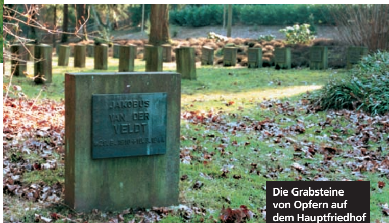
Die Grabsteine von Opfern auf dem Hauptfriedhof in Saarbrücken

Die Zahl der Todesopfer des Lagers kann bis heute nicht genau festgestellt werden. Die Namen von 82 Ermordeten sind offiziell dokumentiert, darunter 43 Franzosen, 15 Bürger aus der Sowjetunion, 9 Polen, 4 Deutsche. Die »Sportfolter« um den Löschteich zusammen mit der katastrophalen Mangelernährung der Häftlinge führte zu zahlreichen Todesfällen. Außerdem wurden sehr viele Häftlinge erschossen.