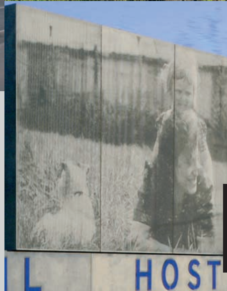
Vor aller Augen: Das Foto auf dem Billboard zeigt eine Familien- idylle vor dem Gestapo-Lager.

»Die Neue Bremm war ein schreckliches Lager. In den anderen Lagern kam der Tod langsam, aber in Saarbrücken kam er schnell.«