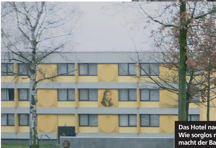
Das Hotel nach der Neugestaltung der Gedenkstätte. Wie sorglos man noch vor 30 Jahren mit der Vergangenheit umging, macht der Bau des Hotels auf diesem Gelände deutlich.