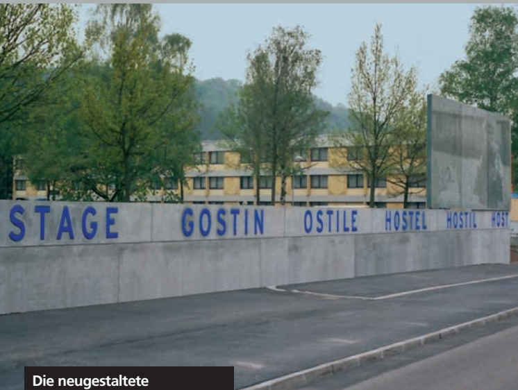
Die neugestaltete Gedenkstätte »Neue Bremm« mit dem Leuchtschriftband.

Das Gestapo-Lager »Neue Bremm« liegt am Stadtrand von Saarbrücken, in der Nähe der französischen Grenze, an der Metzger Straße, die nach 800 Metern in die route nationale (N3) übergeht. In einer Entfernung von etwa 300 Metern befindet sich in nordwestlicher Richtung der Hauptfriedhof, in südöstlicher Richtung liegt Spichern.