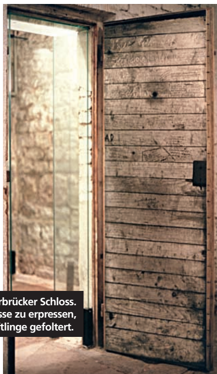
Gestapo-Zelle im Saarbrücker Schloss. Um Geständnisse zu erpressen, wurden die Häftlinge gefoltert.

Sie dienten u.a. zur Disziplinierung und wurden zu Terrorstätten. Zuständig für das Lager »Neue Bremm« war allein die Gestapo in Saarbrücken mit Sitz im Schloss. In der dortigen Gestapo-Zelle wurden bis zu 30 Menschen eingesperrt, bevor sie verhört wurden.